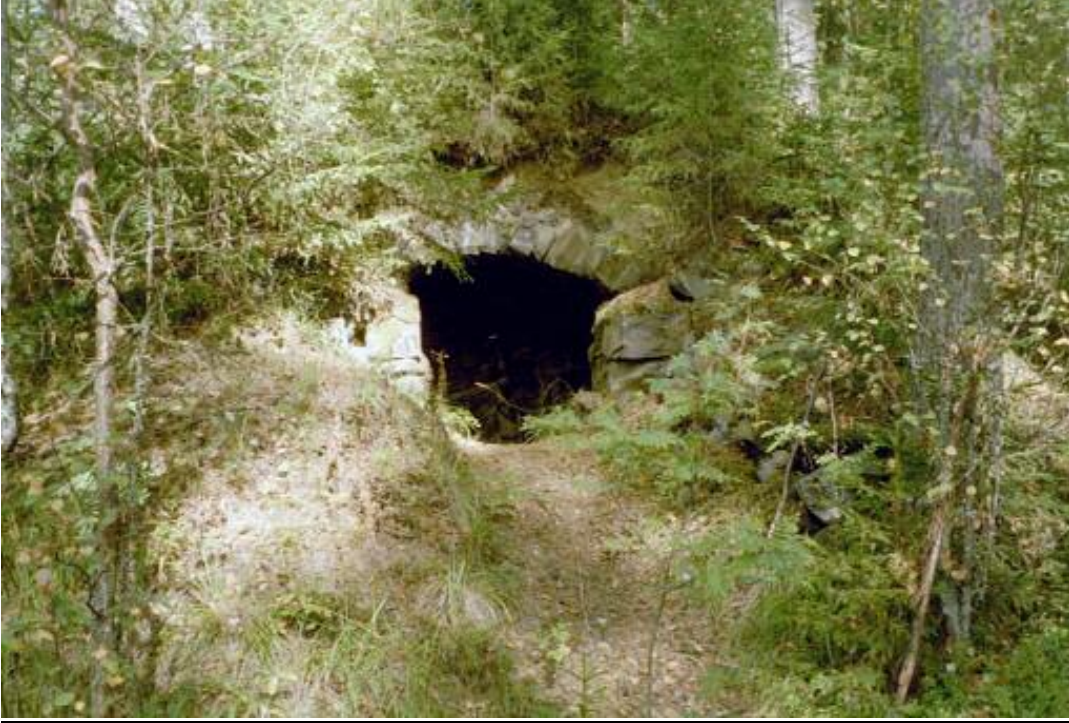
Kellarin oviaukkoa louhoksen äärellä.