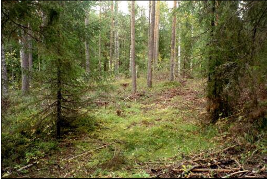
Kuvattu asuinpaikkatasanteen länsireunalta itään.