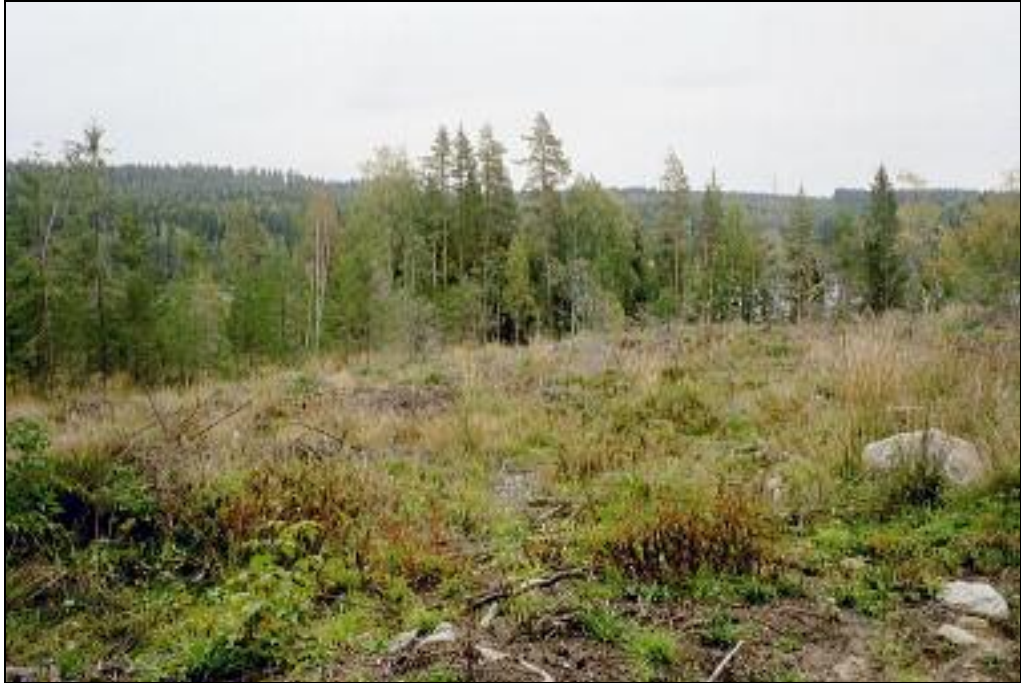
Kuvattu itään. Asuinpaikkatasannetta kuvan alalla.