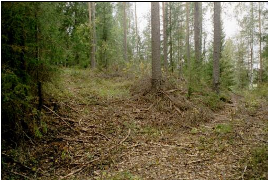
Kuvattu asuinpaikkatasanteen alapuolelta idästä länteen. Asuinpaikka kuvan vasemmassa puoliskossa ylempänä olevalla tasanteella.