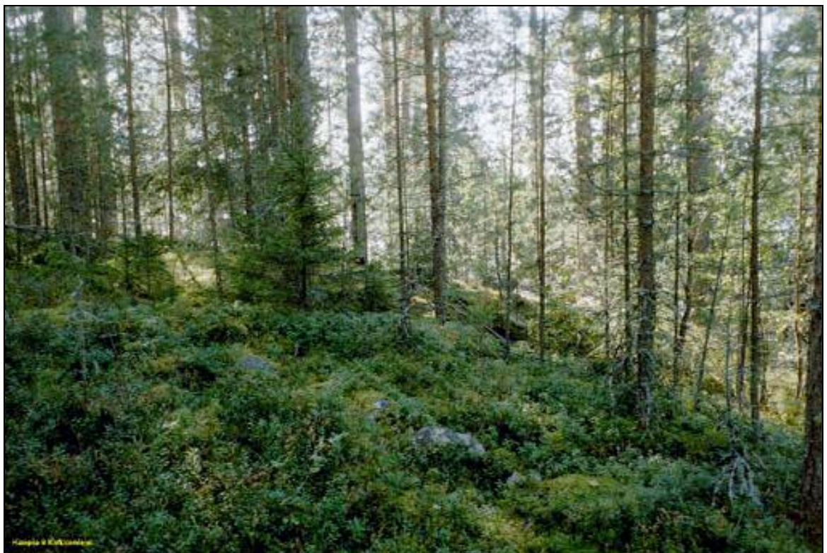
Lapinraunio kauempana kallion kärjessä, etualalla epämääräinen raunio. Kuvattu länteen.