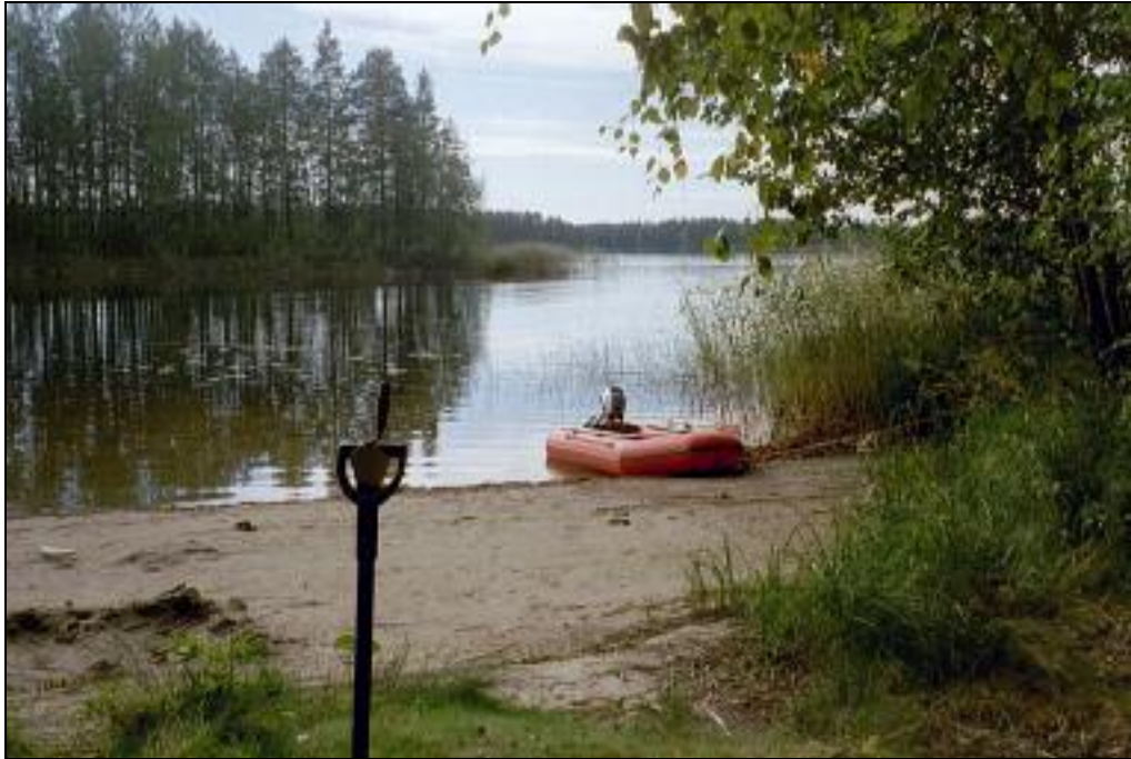
Kuva: rantautumispaikka Laivonsaassa grafiittilouhoksen alapuolisella rannalla

pyritään "onnen" osuus supistamaan mahdollisimman vähiin. On varsin mahdollista osuttaa koekuoppa löydöttömälle kohdalle löytörikkaallakin asuinpaikalla. Satunnaisen ja harvan koekuopituksen tai yhden ihmisen tekemän pellon pintapoiminnan tuottamien havaintojen ja löytöjen perusteella ei saa tehdä vähänkään pidemmälle meneviä päätelmiä asuinpaikan arvosta, laadusta tai intensiivisyydestä. Inventoija havaitsee ja paikantaa muinaisjäännöksen (muinaisen ihmisen asuin- tai työ- tai muu toimintapaikka) ja hyvässä lykyssä myös kykenee arvioimaan sen laajuuden; ei enempää. Tarkemman käsityksen muinaisjäännöksestä saa sitten (koe-) kaivaustutkimuksilla.