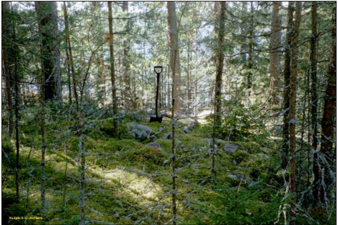
Lapinraunio kallion luoteiskärjessä