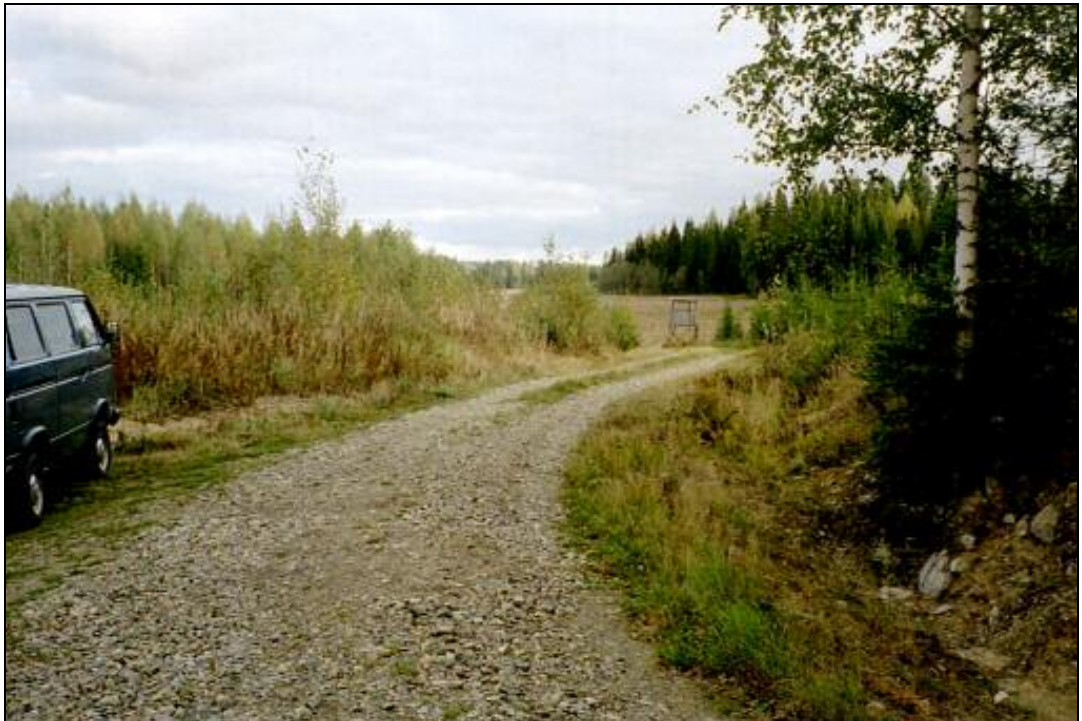
Kuvattu etelään. Asuinpaikkaa mutkan jälkeen, autosta n. 10 eteenpäin tien varrella, vasemmalla puolen.