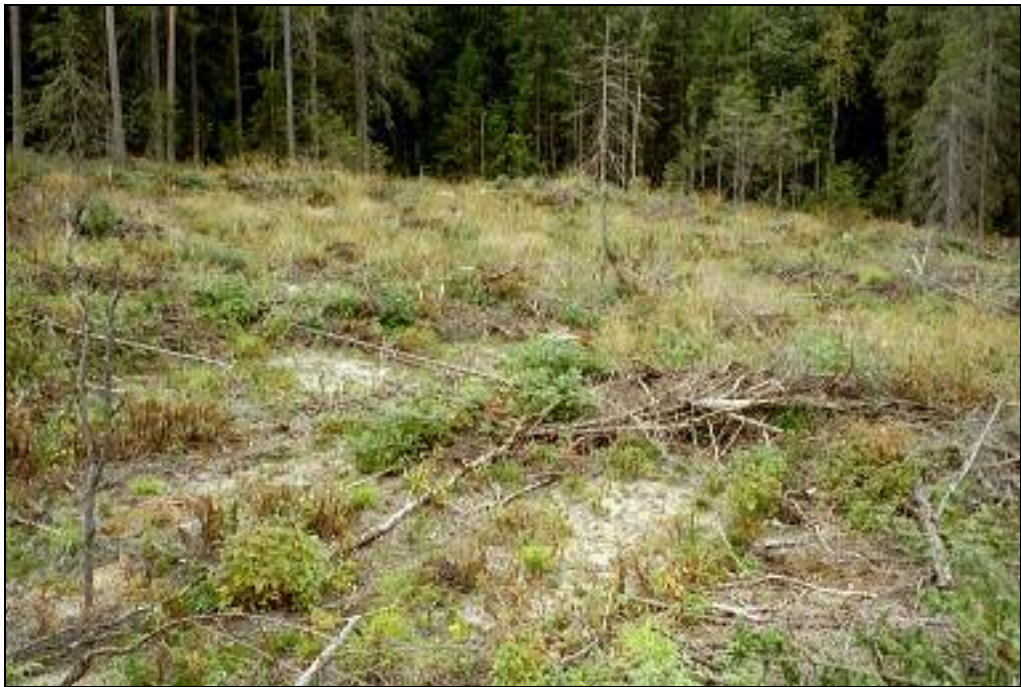
Kuvattu lounaaseen. Asuinpaikkaa laikutetussa metsämaassa.