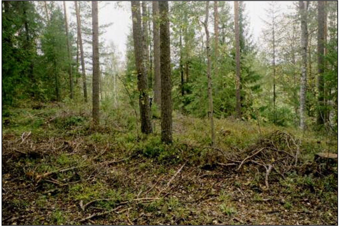
Kuvattu asuinpaikalta pohjoiseen. Asuinpaikkaa kuvan etualalla.

Siilinjärvi Kehvo Kuoppaharju S, KM 33416