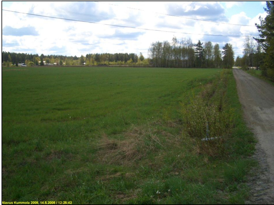
Tutkimusalueen pohjoisosaa kuvattuna etelään. Oikealla Kumolantie.