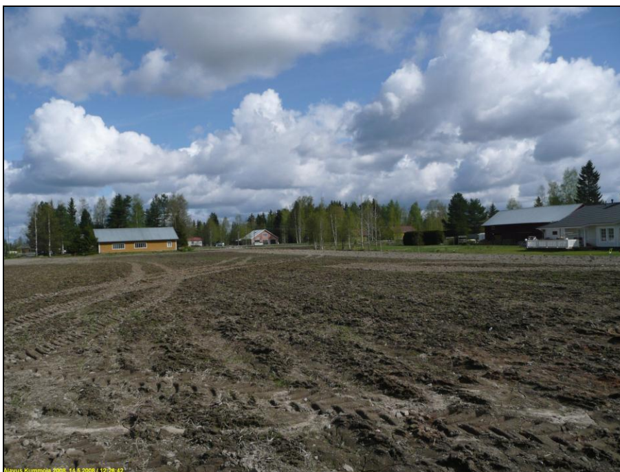
Kumolan kaava-alueen itäosa, kuvattu itään.