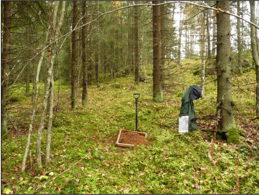
Kyröskosken harjun lakialue ja ylärinne on lajittunutta hiekkaa 3-tien vieressä kaava-alueen länsiosassa. Kuvassa koekuoppa josta otettu maa seulottiin.