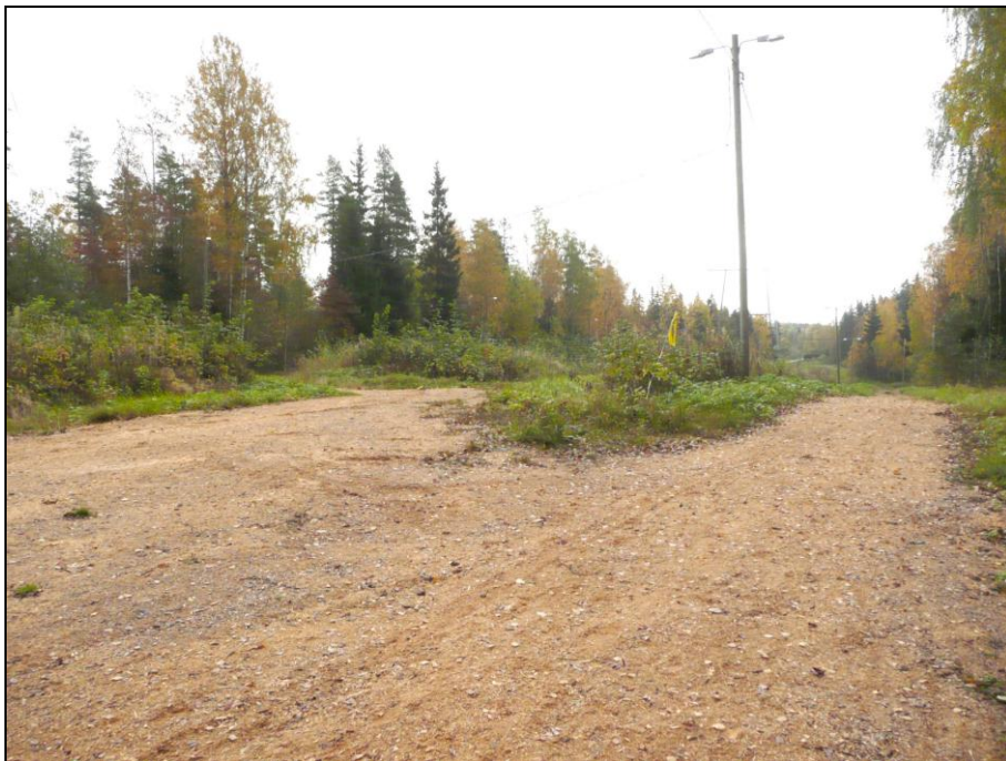
Kaava-alueen vielä rakentamattomilla alueilla risteilee ulkoilureitti