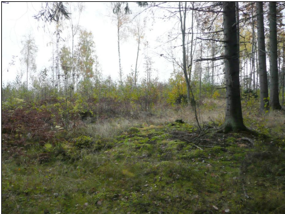
Kyröskoskenharjun alarinteiden kuusikkoa ja pusikoitunutta hakkuualuetta kaava-alueen keskivaiheilla.