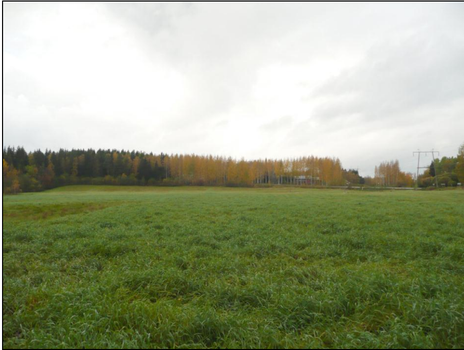
Kaava-alueen luoteisosassa oleva pelto on nurmella