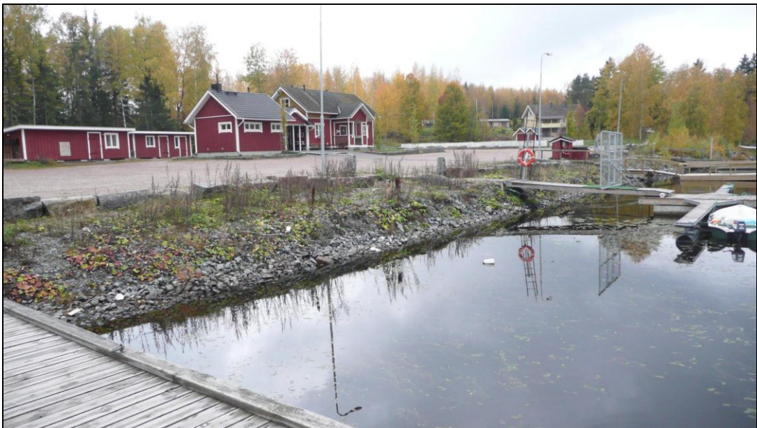
Venesatama kaava-alueen pohjoisosassa Kyrösjärven rannalla