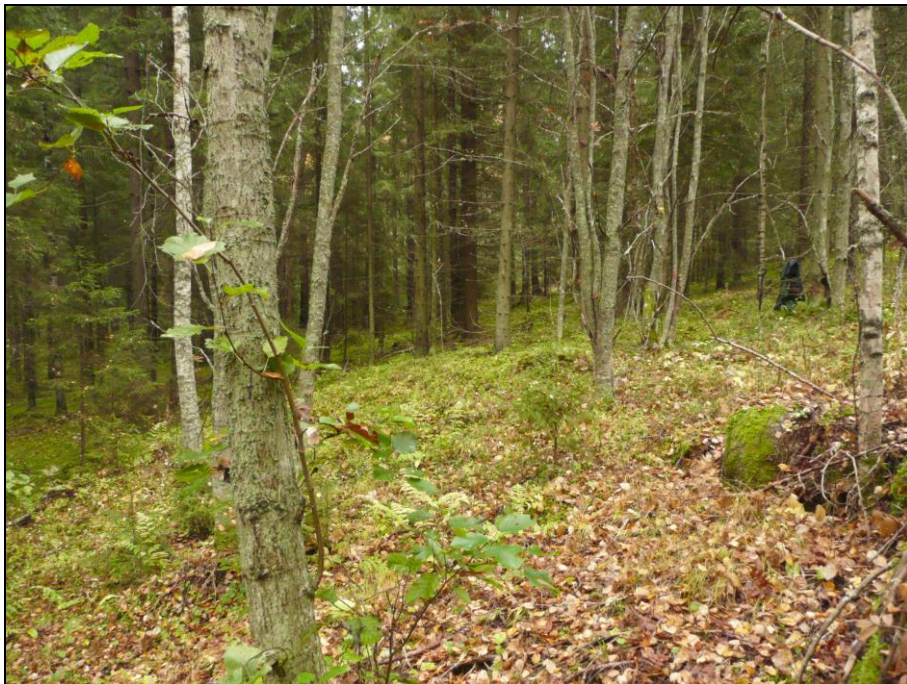
Kyröskoskenharjun muinainen Ancylusjärven rantaterassi.