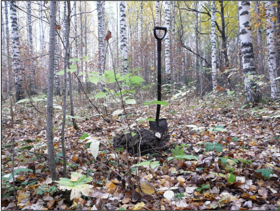
Metsittyntä peltoa venesataman ja sahan välisellä alueella. Ennen Kyrösjärven laskua paikalla on ollut järvelle pistävä niemi. Maalaji alueella savimultaa.