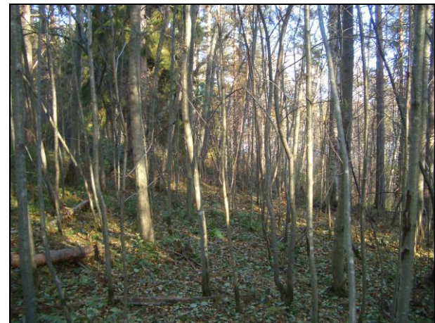
Pellon pohjoispuolista lehtoa, törmän päällystasannetta, vanhaa peltoa.