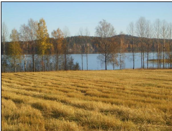
Sararannan peltoa, vastarannalla keskellä Sarakallio. Kuvattu itään.