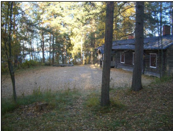
Kylmäniemen kärkeä, kuv. pohjoiseen