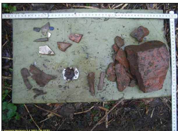
Kuopan pintaosan antia.