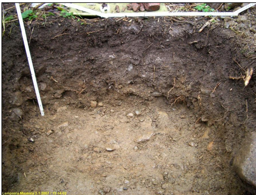
Koekuopan itäseinämä. Ei merkkejä vanhemmasta kulttuurikerroksesta. Alla eteläseinämä.