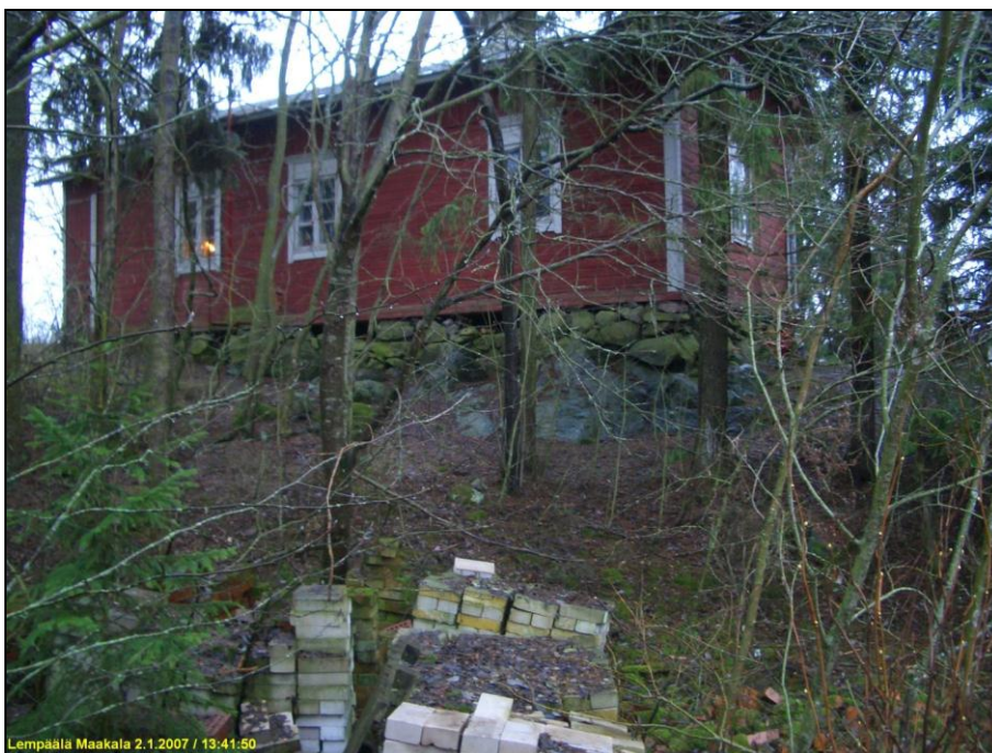
Kumpulan talon länsipuoli ja kallionnurkka. Alla Kumpulan talon itäpuoli, pengerretty laki.