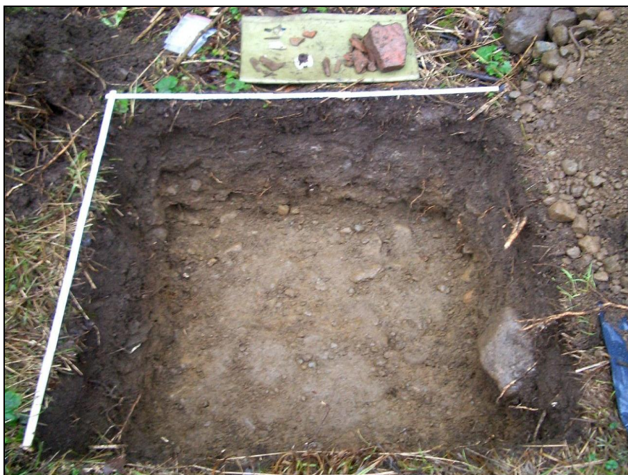
Koekuoppa, puhdas ja koskematon pohjamaa on kaivettu esille.