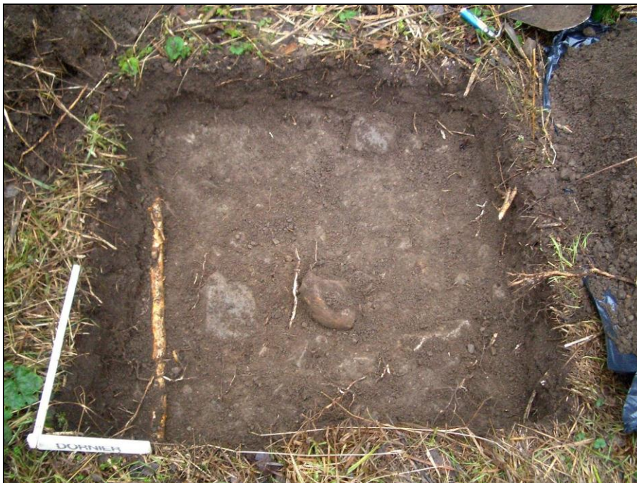
Koekuoppa, jossa on kaivettu pois pinnassa ollut löytökerros, sen alla vanhemman ajan sekoituneen kerroksen pinta