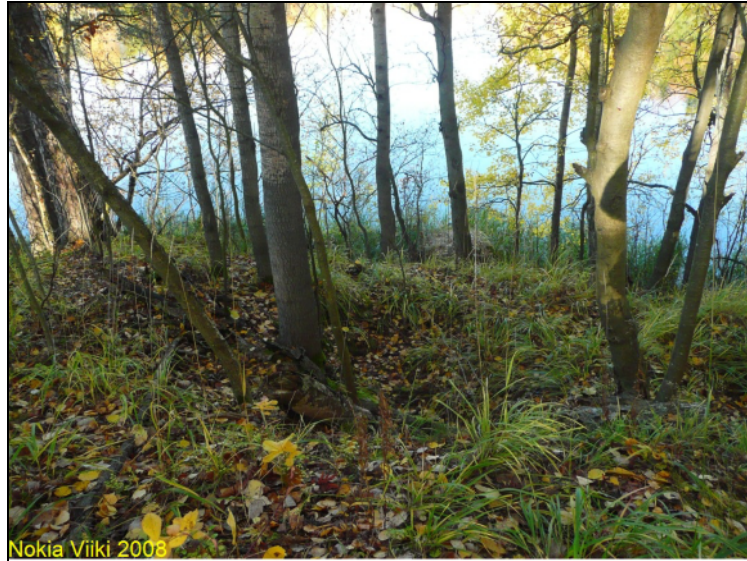
Rantatörmää alueen länsiosassa