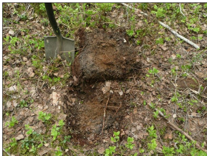
Alueella maaperä on pääosin hiekkamoreenia. Kuva koekuopasta.