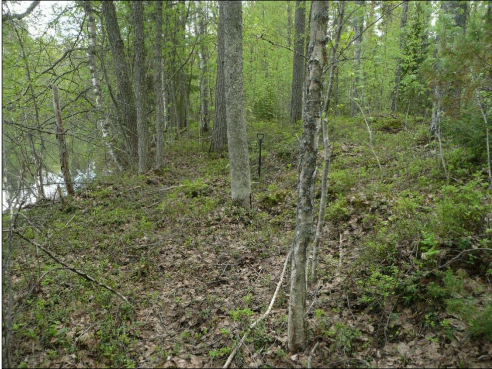
Tasainen rantatörmä. Tutkimuksissa tiheästi kuopitettu alue.