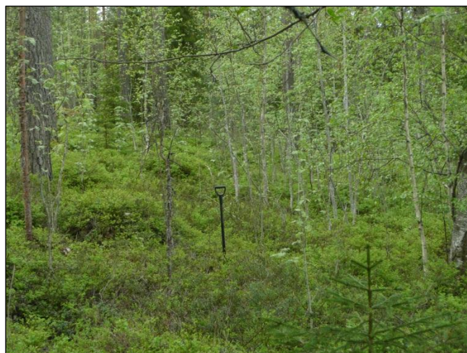
Jyrkkäpiirteistä ja kivikkoista alueen maastoa