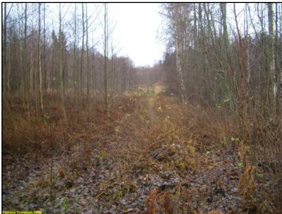
Niemen länsiosasta itään, vanhaa peltoa