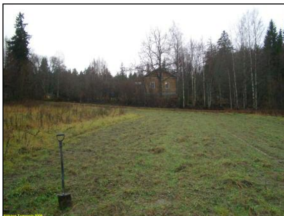
Takana Tommolän talo. Kuvattu etelään.