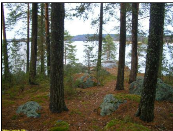
Niemen kärki, kuvattu luoteeseen