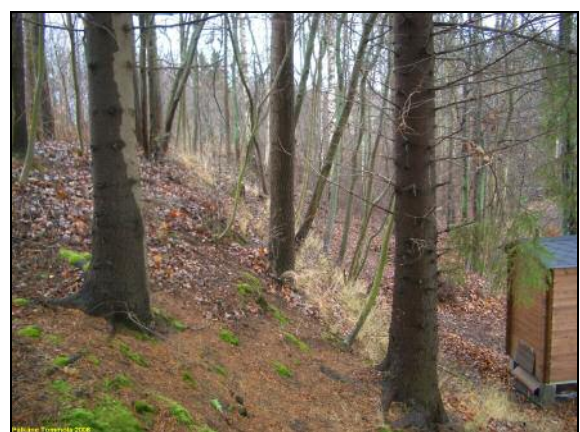
Niemen pohjoisrannan vanha törmä.