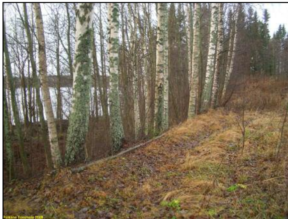
Länsiosan pohjoisrannan törmää