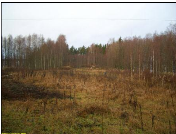
Puhdistamon N-puolinen pelto. länteen.