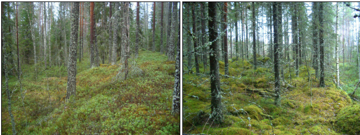
Vanhaa rantatörmää alueen pohjoisosassa ja alueen eteläosassa, missä maaperä louhikkoista