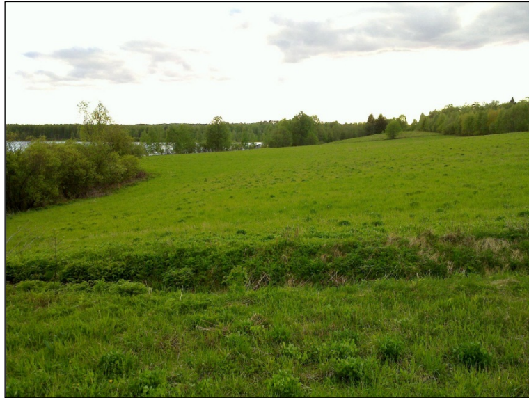
Alueen länsiosaa kuvattu alueen keskivaiheilta länteen. Ja alla itään.