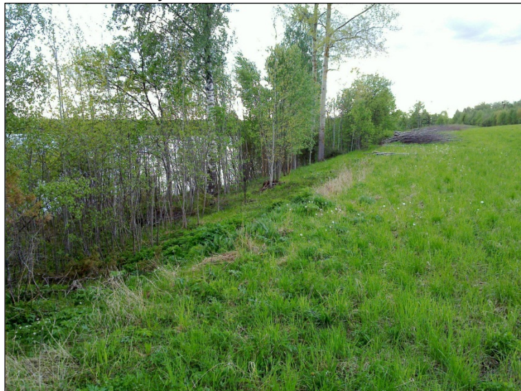
Pelto ja rantatörmä alueen keskellä