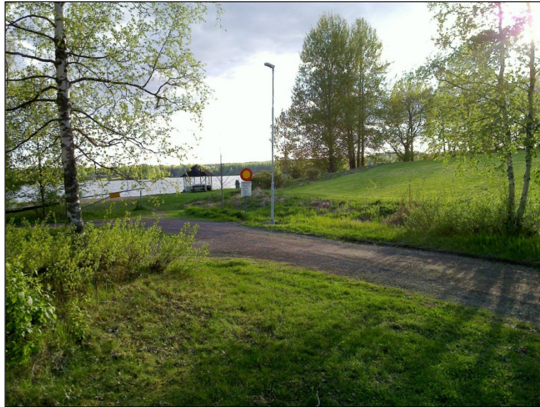
Alueen itäreunaa, uimaranta niemessä.