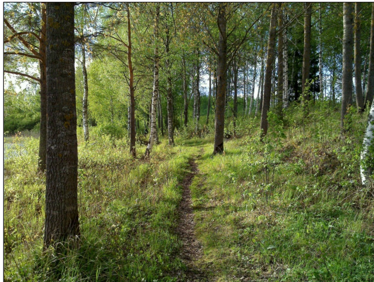
Vesijättö ja vas. törmä heti uimarannan länsipuolella