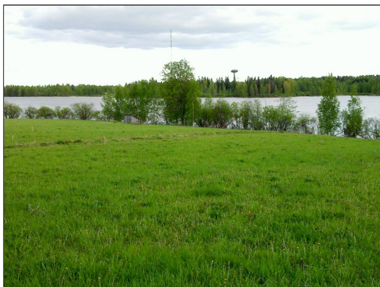
Alueen länsiosan rantapeltoa.