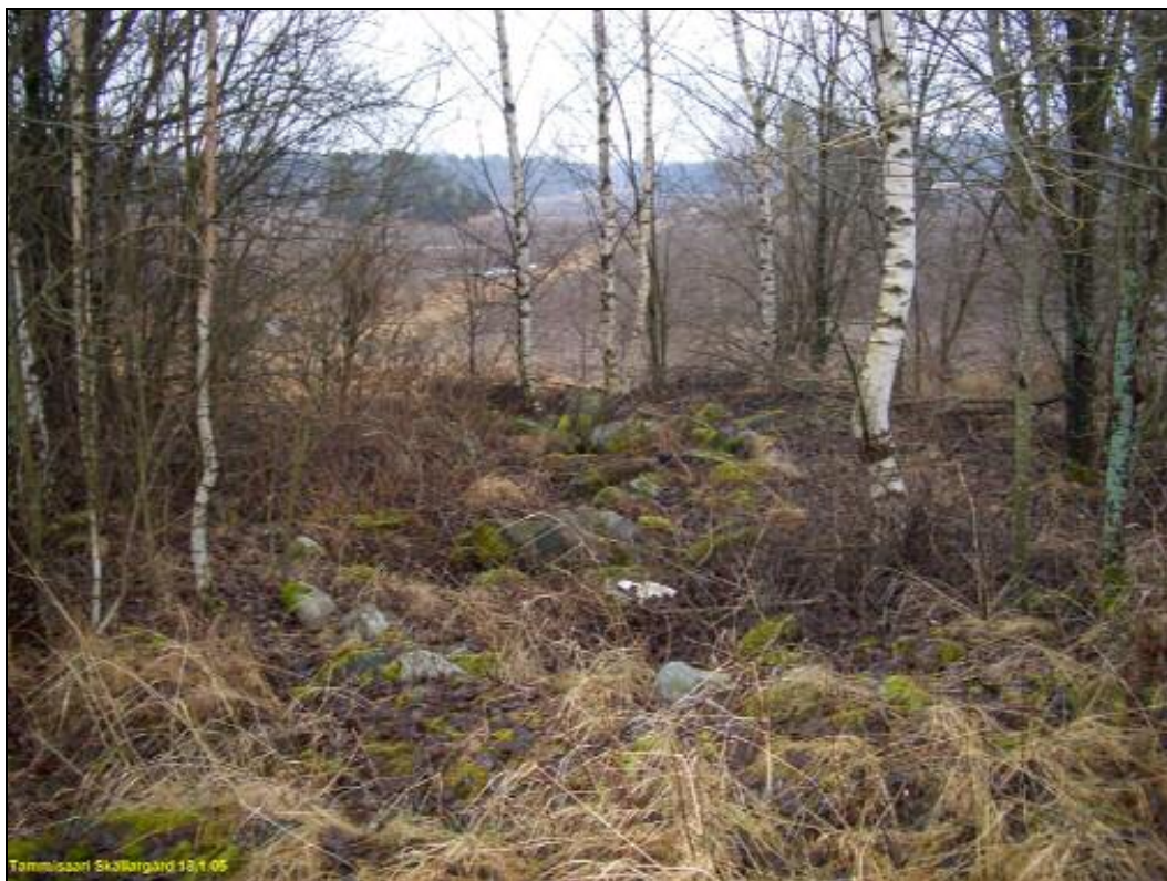
Edellisten kuvien oikealla, itäpuolella, oleva kivillä täytetty kuoppa, kuvattu Österbyn suuntaan itä-kaakkoon.