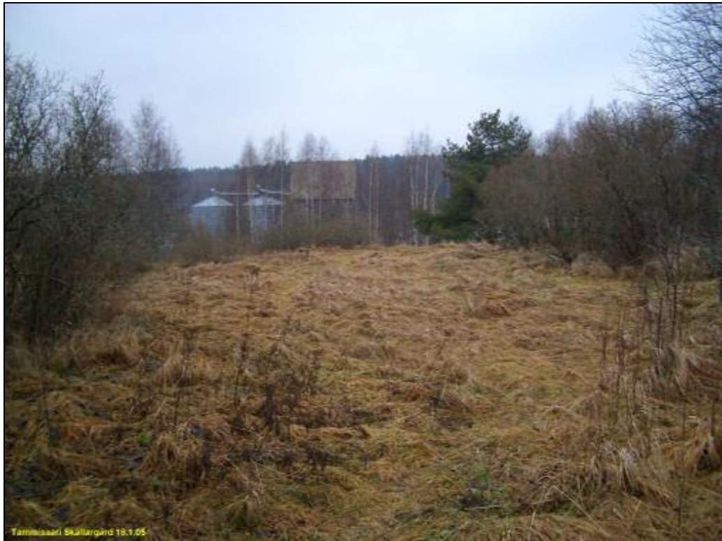
Sköldargårdintien mutkan pohjoispuolella oleva ylätasanne, joka vaikutti ainakin osin olevan läjitysmaata.