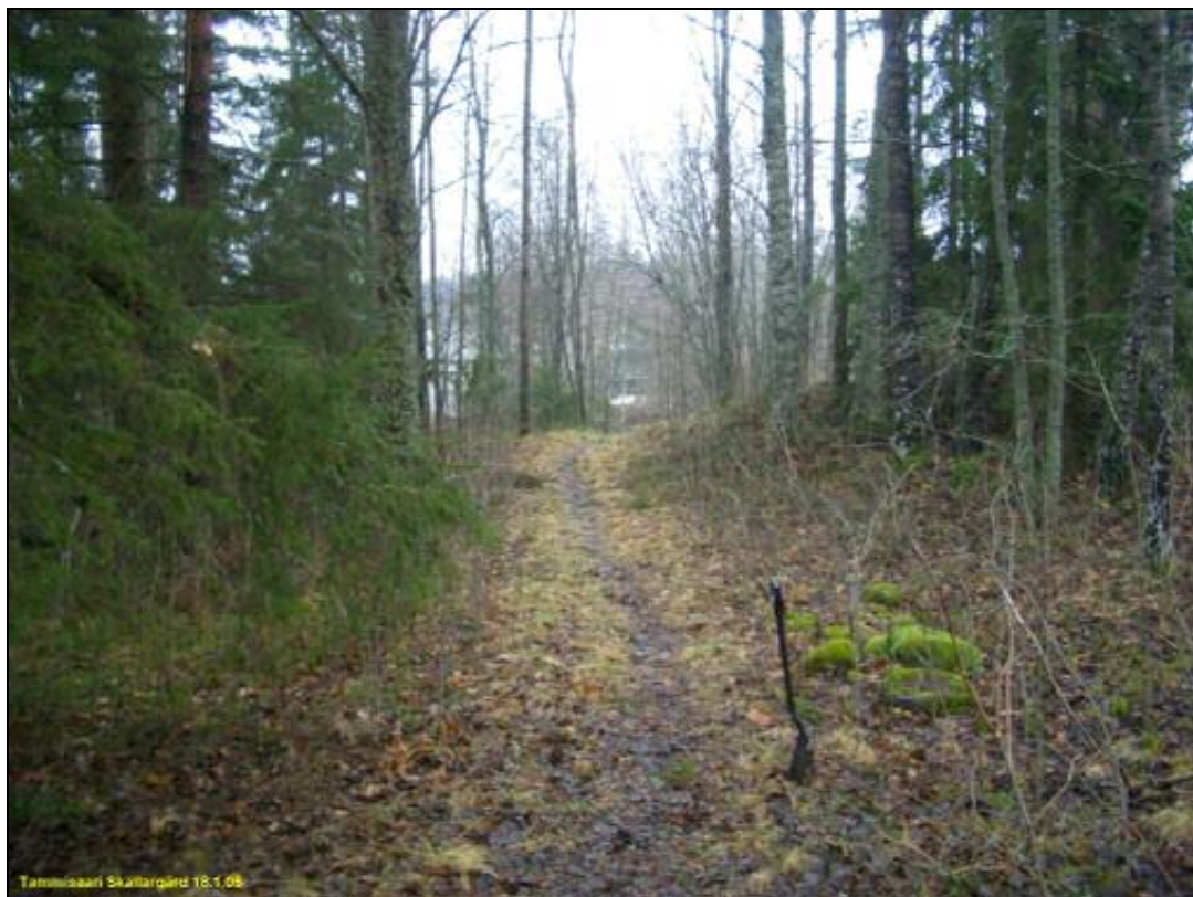
Vanha kuninkaankartassa näkyvä tiepohja Sköldargårdintien eteläpuolella, vedenottamon tasalla rinteiden laella. Kuvattu pohjoiseen.