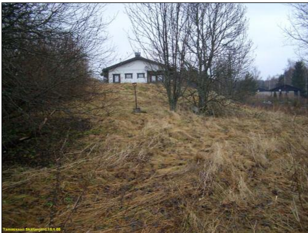
Matala maakasa törmän reunalla lapion kohdalla ja sen oikealla puolella koekuopissa laastin- ja tiilenpaloja. Kartalla kohteen 1 laidalla oleva punainen piste. Kuvattu koilliseen.