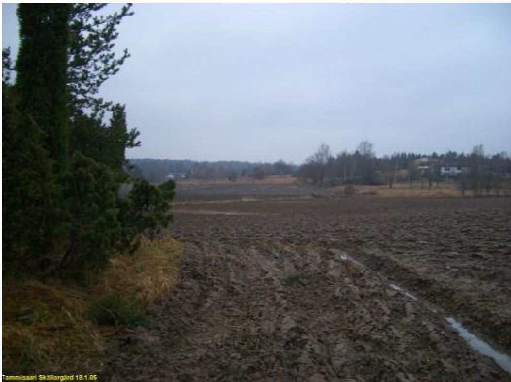
Paikalta 3 (kartalla) otettu kuva luoteeseen kohti Sköldargårdintietä. Tällä kohden pellossa oli hieman enemmän tiiltä ja keramiikkaa.