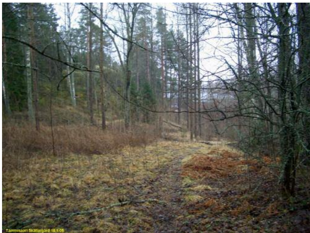
Vanha tienpohja, tien mutkan kohdalla, kuvattu lähes samalta paikalta kuin edellinen kuva, mutta etelään.