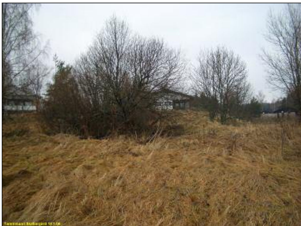
Sama kuin yllä, mutta kauempaa. Sköldargårdintien mutkan koillispuolella, pellon ja tien välillä.