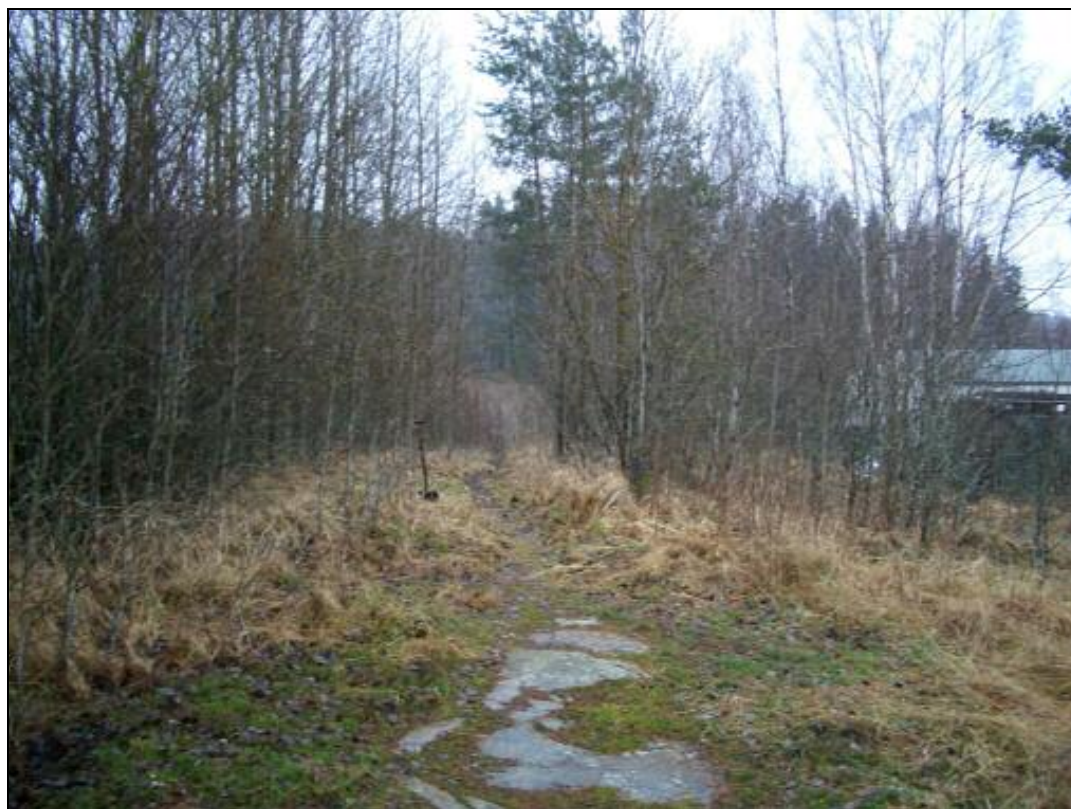
Vanha kuninkaankartassa näkyvä tiepohja heti Sköldargårdintien kalliroleikkauksen eteläpuolella. Kuvattu etelään.