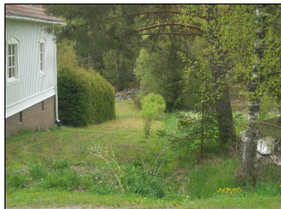
Kuvassa vanhan sillan kiviarkun rauniot (isojakokartalla itäisempi silta) ja oikealla sama kylätietä kuvattuna – vanha sillalle menevä tie nurmikkona.