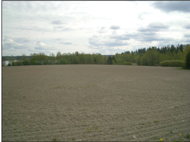
Tutkimusalueen peltoa kuvattuna kylätontin pohjoispuolelta itä-kaakkoon. Alla kuvattu itään kylätontin keskeltä. Tien molemmin puolin vanhaa kylätontin aluetta.