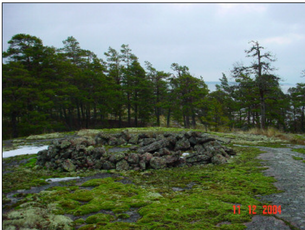
Tykkiasemaksi tulkittu kivikehä, mahdollisesti 1700-luvulta.'