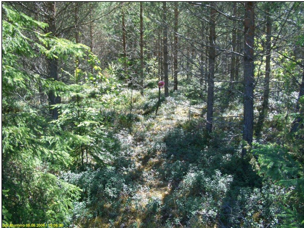
Löytökoekuoppa kuvan keskellä. Kuvattu etelään.