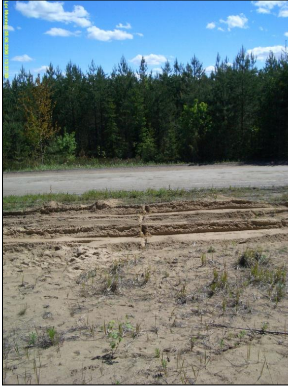
Kuvattu etelään Munterontien pohjoispuolelta. löytöpaikka on tältä kohden 16 m etelään tien eteläreunasta.