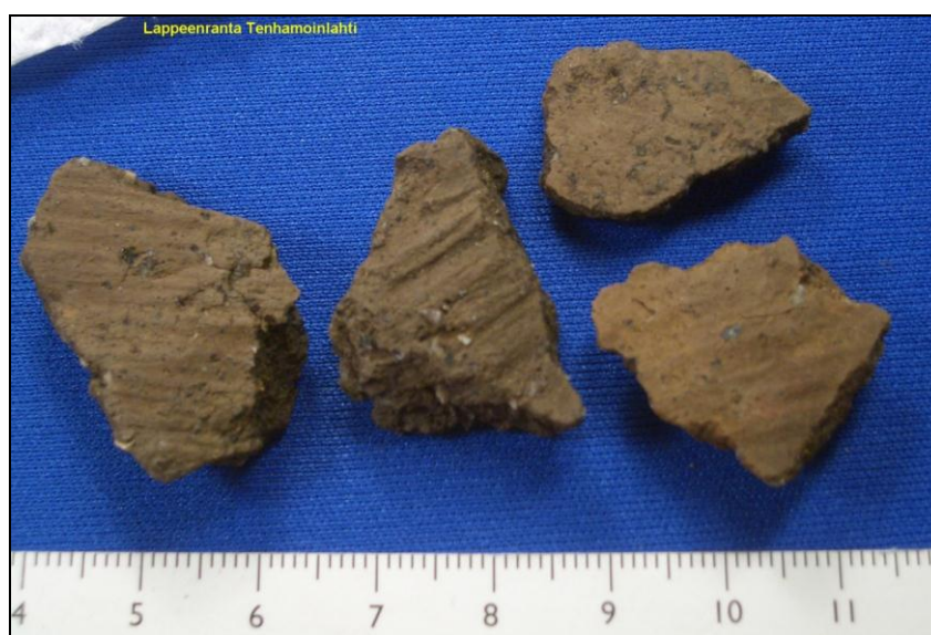
Paikalta löytyneitä saviastian palasia. Alla yläkuva kahden vas. puoleisen palan sisäpuolet.