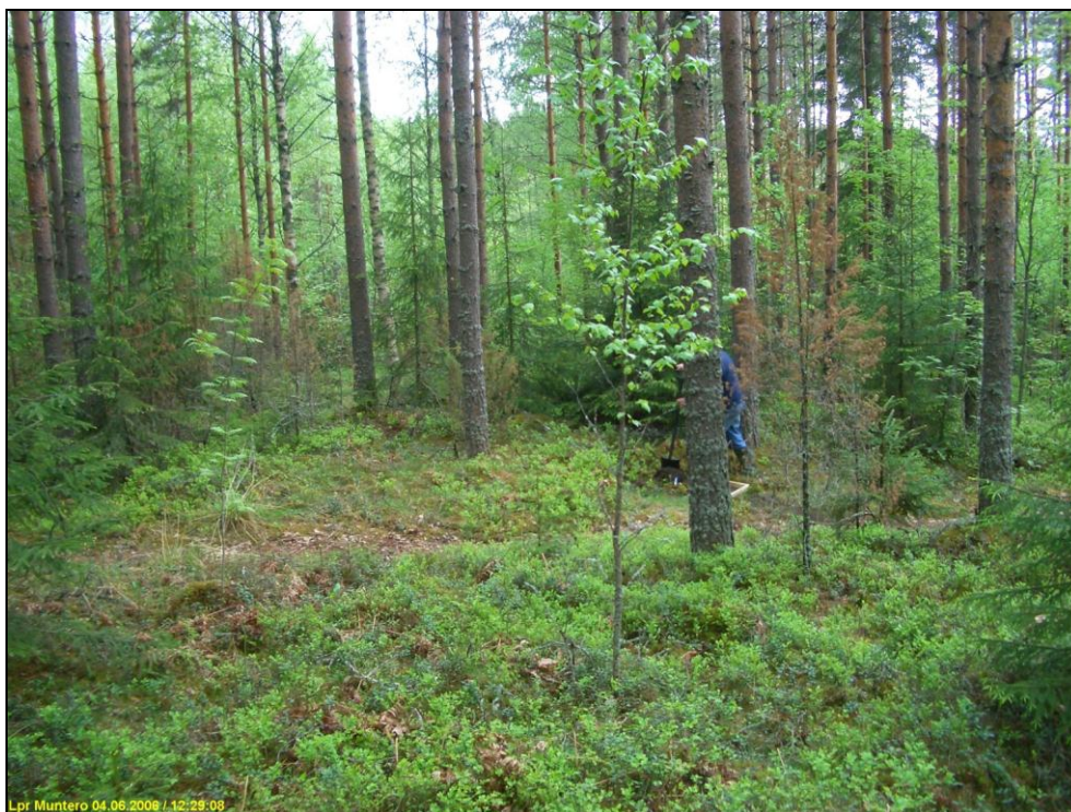
Tenhamoinlahden asuinpaikkaa kuvan alalla. Kuvattu lounaaseen.