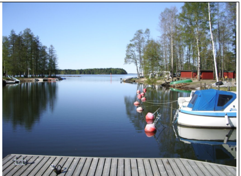
Kostianvirran suu laivalaiturilta idästä. Oikealla leirintäaluetta.