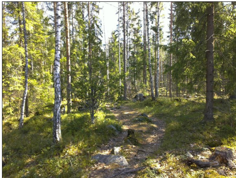
Pohjoisosassa laen yli kulkeva polku