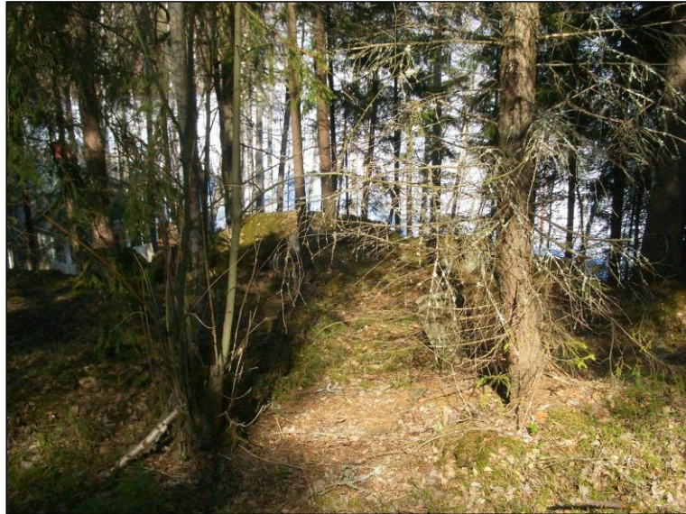
Pohjoisosan laen reunaa