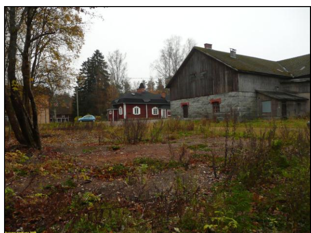
Puretun rakennuksen paikka