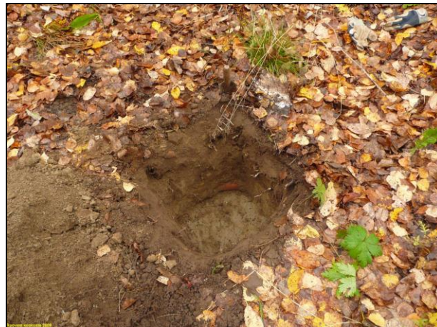
Koekuoppa 2, pohjalla nurkassa salaojaputki