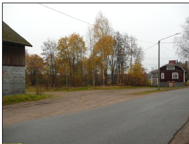
Laivarannantieltä itään. Alue tien takana vas.