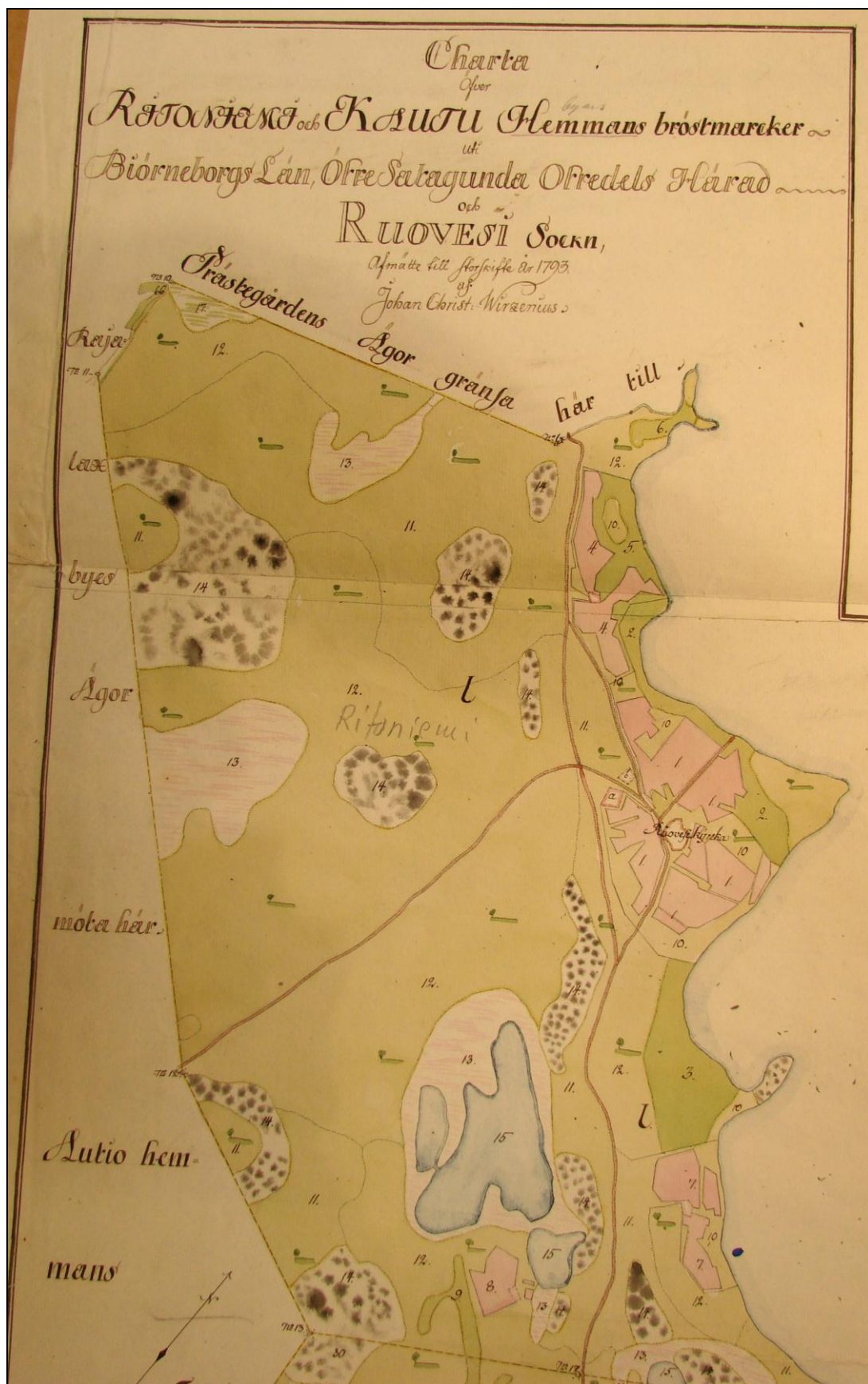
Ote toimituskartasta 1793. Seur. sivulla siitä osasuennos jossa tutk. alue merkitty.