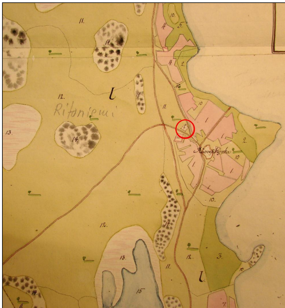
Osa isojakokartasta. Tutkimusalue merkitty punaisella ympyrällä. Riihitie on kulkenut nykyisen pellon yli kulkevan sähkölinjan kohdalla kirkon puoleisessa päässä.