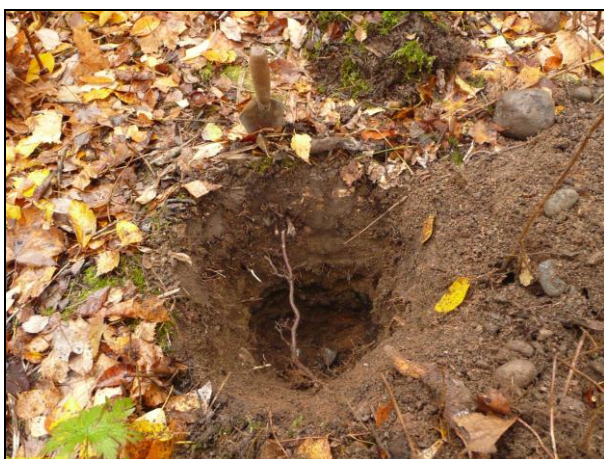
Koekuoppa 5. Kovaa soraista ja sekoittunutta maata – täytemaata, kuten kuopassa 4 mutta paksumpi kerros. Alla resentti multakerros.