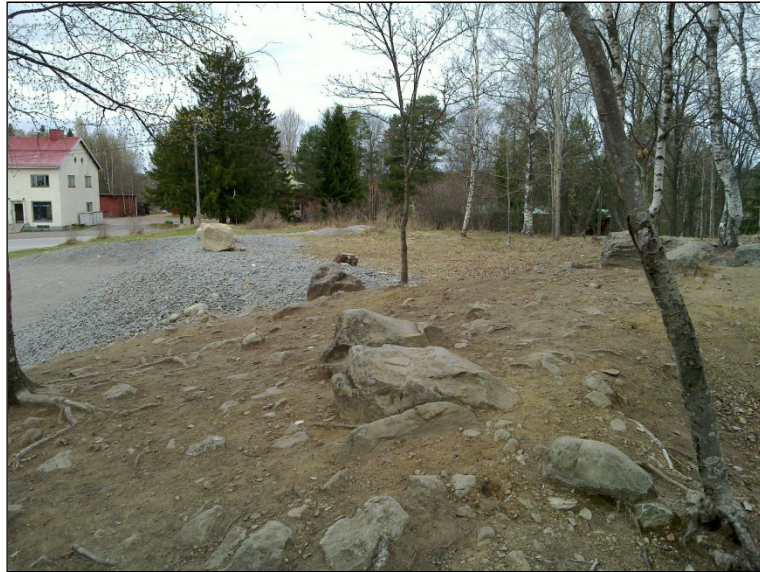
Alueen pohjoisosaa länteen. Paikalta (vas.) on purettu ilmakuvassa näkyvä rakennus