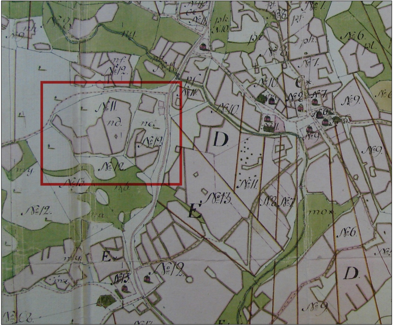
Ote kartasta 1766 A66-5. Tutkimusalueen sijainti merkitty päälle punaisella neliöllä.