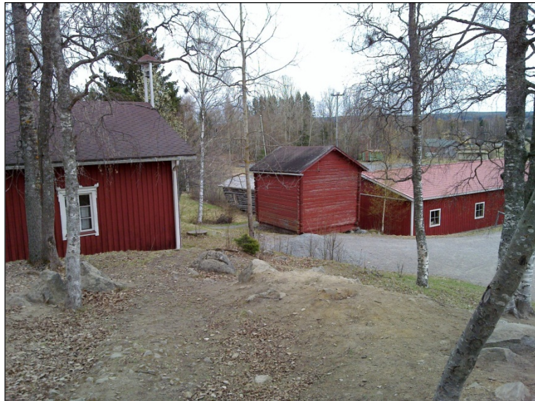
Näkymä koulun pohjoispuoliselta mäeltä kaakkoon.