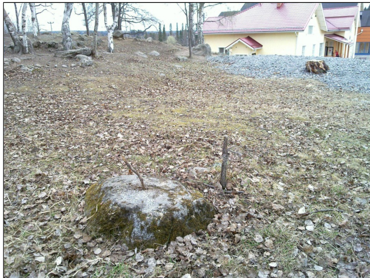
Vanha rajamerkki koulun pohjoispuolella. Kyseessä kivi jossa porattu pulttinreikä. Nuori merkki.. Alla käytössä oleva tontin rajamerkki lohkokivessä alueen itäosassa. Eivät muinaisjäännöksiä.