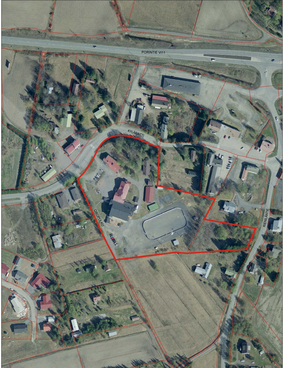
Kaava- ja tutkimusalue. Kuva Sastamalan kaupungilta.