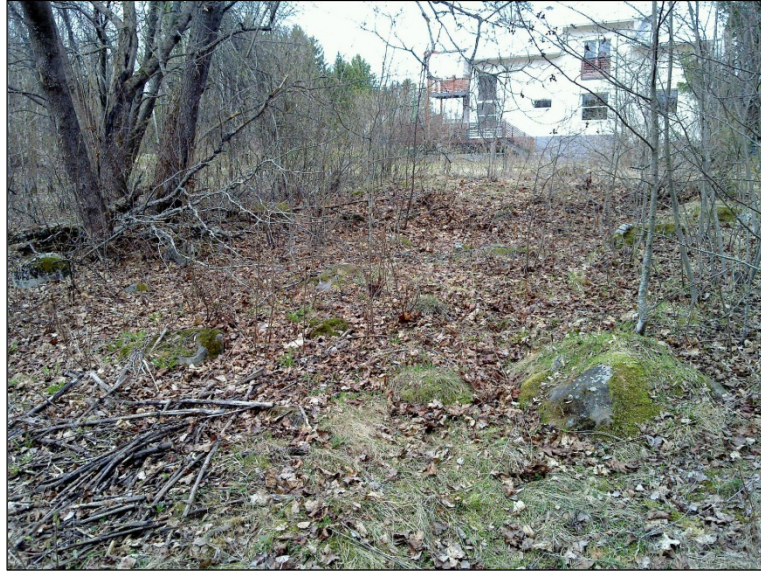
Alueen itäosan pusikkoista aluetta pohjoiseen.