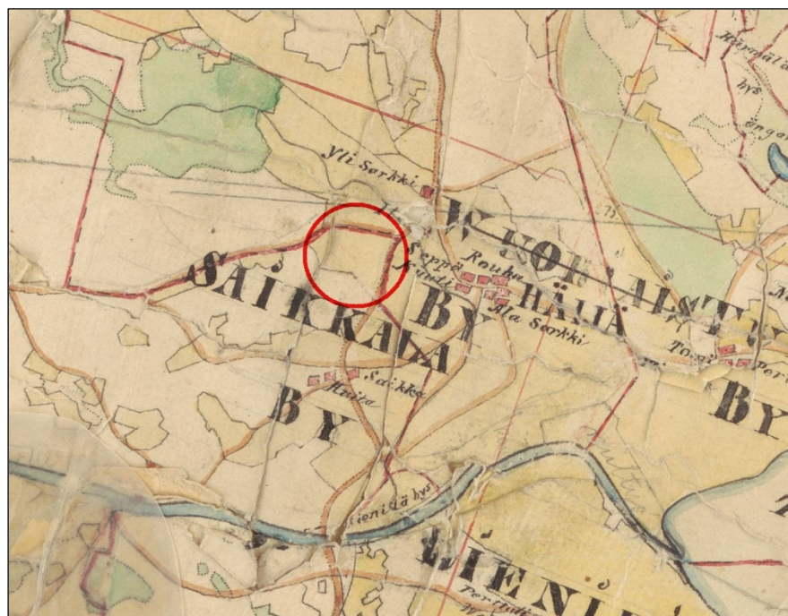
Ote pitäjänkartasta 1840-luvulta. Tutk. alueen sijainti merkitty pun. ympyrällä.