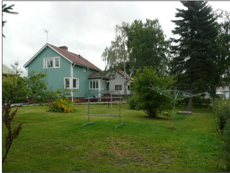
Tontin lounaisosasta koilliseen. Alla keskeltä etelästä luoteeseen.