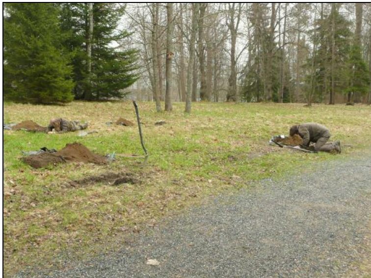
Koekuopitus käynnissä. Kuoppien sisältöä tutkitaan. kuvattu itään. Alla: T Sepänmaa tutkii kuoppaa.