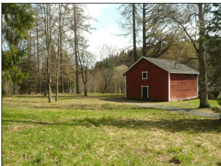
Paikka tutkimuksen päätyttyä. Kuopat peitetty.