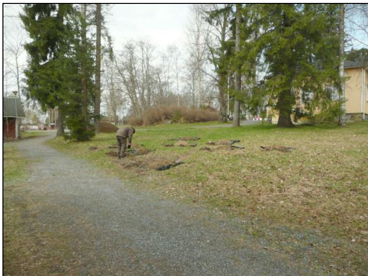
Koekuopitusalue kuvan keskellä, oik. Haiharan kartano. Alla vastakkaisesta suunnasta.