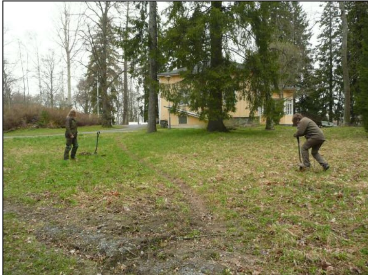
Koekuopitus alkamassa. Taustalla Haiharan kartano. Kuvattu pohjoiseen.