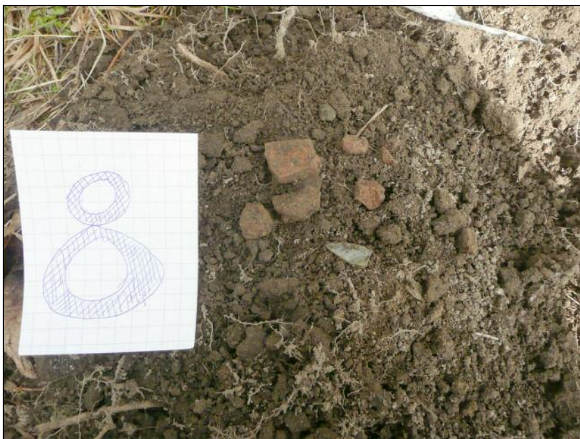
kk 8 pinta