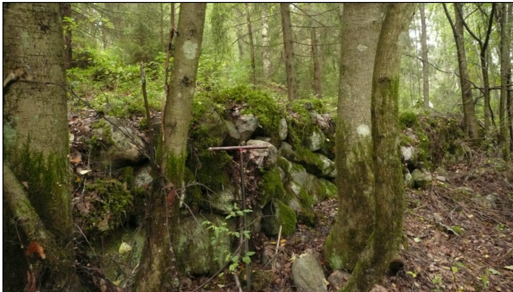
Kiviaita E, talon takana pusikkoisessa metsässä.