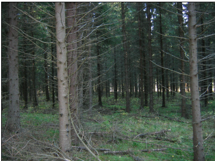
maastoa alueen eteläkärjessä