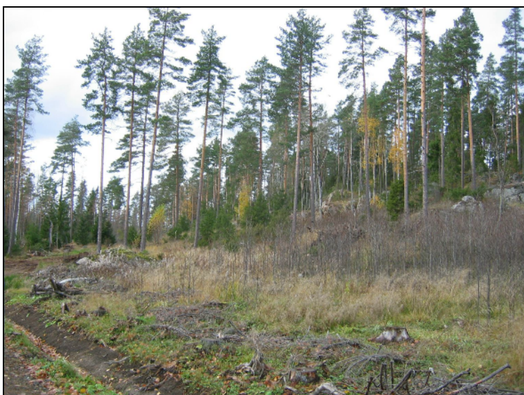
Ojansuunvuoren eteläpuolista rинettä