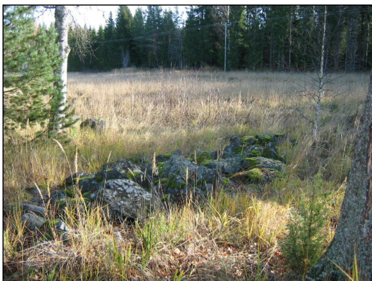
moderni raivauskivikko alueen lounaislaidalla