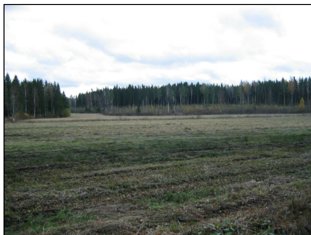
rantapeltoa alueen pohjoisosassa.