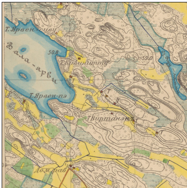
Ote v. 1900 topografikartasta