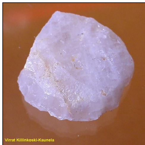
Kaavin. Vasemmassa kuvassa retusoitu terä on vasemmalla, oikeassa alhaalla. Esineen mitat ovat 20 x 19 x 9 mm, terän korkeus 3 mm.