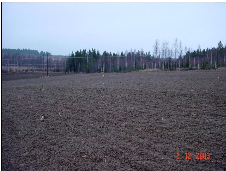
Kuvattu alueen keskikohdalta, ylemmältä tasolta pohjoiseen. Vesijohtolinja sähkölinjan alla.