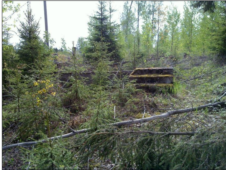
Pienen rakennuksen betoniperusta mäen laella. tien eteläpuolella.