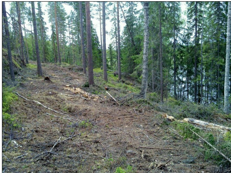
Koikeroisen itärantaa, etelään.