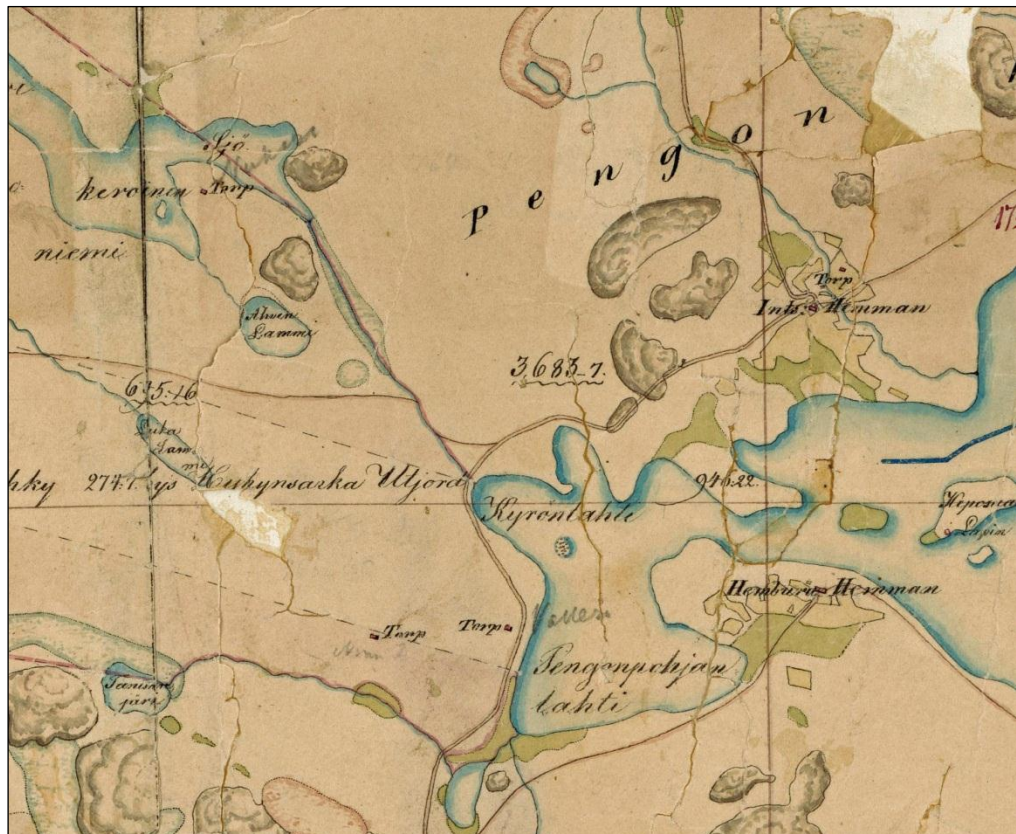
Ote 1840-I pitäjänkartasta