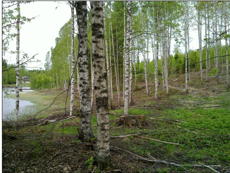
Kyrönlahden rantaa niemen etelärannalla. Länteen.