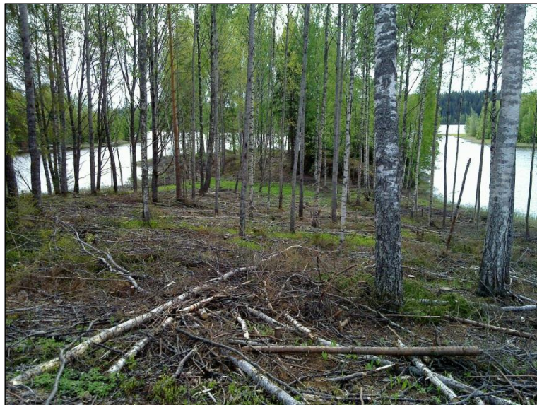
Pieni kapea tasanne mäen kaakkoisrinteessä. Taustalla alava niemennipukka Alla: Niemen kärjen kannakselta kohti ylemmän kuvan tasannetta