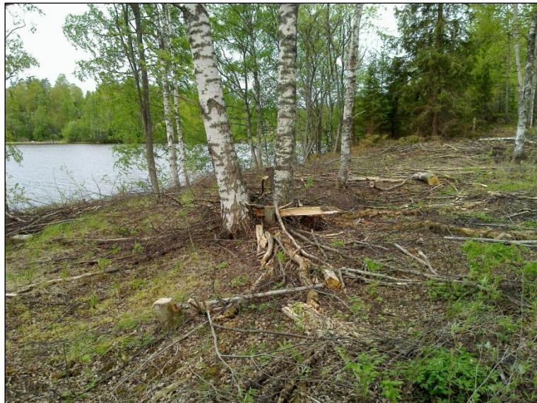
Niemen kärkinipukan (aiemmin saarena) rantaa.